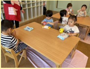
①朝のおやつ いつも牛乳を飲んでます！