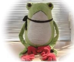
マスコットの かしこちゃん

4月の予約は、 4月3日(水) から受付けます。 子育て支援センターおいかけっこでもお受けいたします。 時間:10:00～16:30