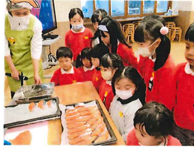
サケの解体ショー