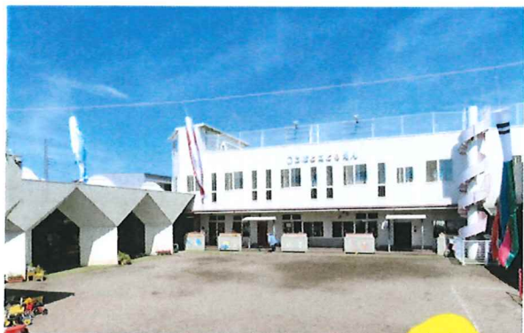
小規模保育園ぷりん